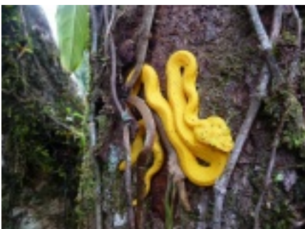
Tiere - Zoo unter freiem Himmel