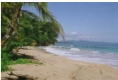
Surfplätze an der Karibik