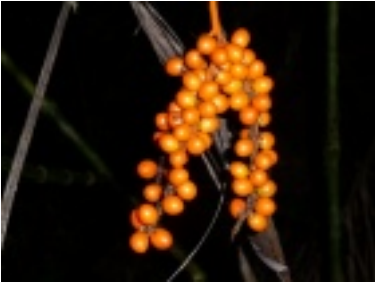
Früchte - auch ein Augenschmaus

http://www.adventurecostarica.ch/index.php?section=gallery&pdfview=1