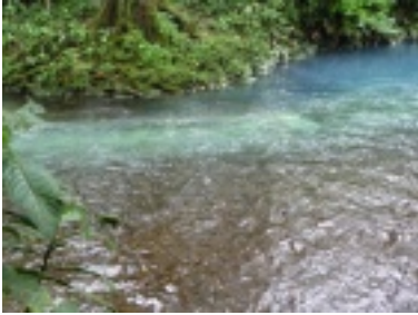
Nationalparks - Oasen für die Natur